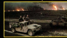
דאָס קליינשטיגע פּוילן ווערט רעקרוטירט צו ראַטעווען אַמעריקע