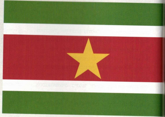
די נאציאנאלע פאַן פונעם לאנד סורינאם

און טייל פונעם דרום-אמעריקאנער געמינט זיך דאס פיצניקע לענדל