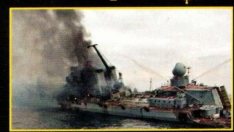
די זינקונג פון דער מאַסקוואַ קרויזער שיף