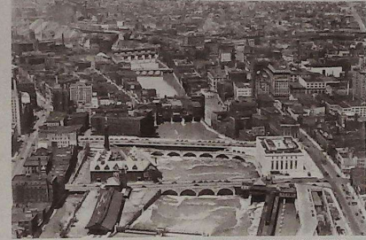
ראטשעסטער און יענע יארן, דער “ערי קאנאל” ציט זיך פון “לעיק ערי”, איינע פון די פינף “גרעיט לעיקס” (גרויסע וואסערן) צווישן ניו יארק און קאנאדע.

אָבער נישט לויפן האט ער אויך מורא געהאט! איז ער ווייטער געגאנגען, מיט די גרעסטע טריט וואס ער האט נאר געקענט, אראפקונדיג צו דער ערד. “העלף מיר, רבונו של עולם!” האט ער געשעפּשעט. “באשיץ מיה פון די רשעים!”