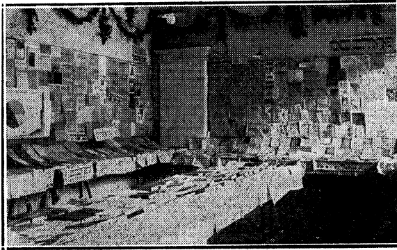
פרעסע-אויסשטעלונג אין אידישען וויסנשאפטליכען אינסטיטוט.

א דריטער אפצווייג פון ארכיוו, ער מאָנסקריפטען-ארכיוו, גיט זיך אפ מיט קלייבען געשריבענע דאָקומענטען. דאָ געפינט איהר אויף