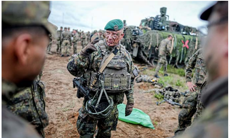
Deutsche Soldaten in Pabradė, verfallener Bunker: Täter-Opfer-Umkehr

Seit Russland die Ukraine im Februar 2022 angegriffen hat und damit nach An-