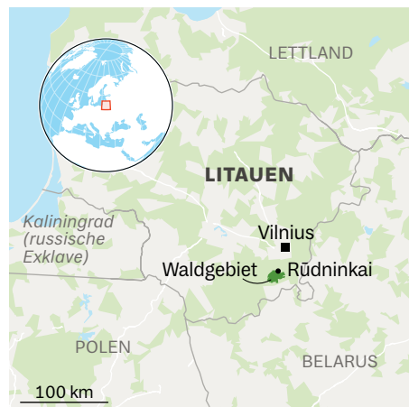
5 Grafik, Karte: OpenStreetMap

Mikulskienė läuft zielstrebig in eine Richtung und biegt einen großen Ast beiseite. Auf einem bemoosten Findling leuchtet eine kleine silberne Platte: »Zum Gedenken an die jüdischen Partisanen, die aus diesen