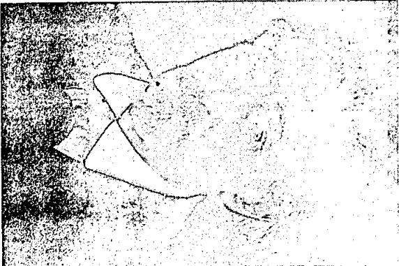
ש. אַג-סקי 1863 — 1920