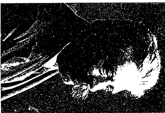
י. ל. פּרץ 1852 — 1915