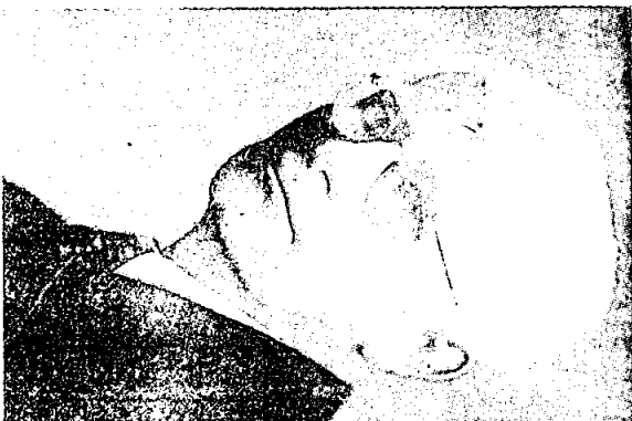
ה. ליינוויק 1888 — 1962