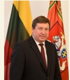
Krašto apsaugos ministras Raimundas Karoblis