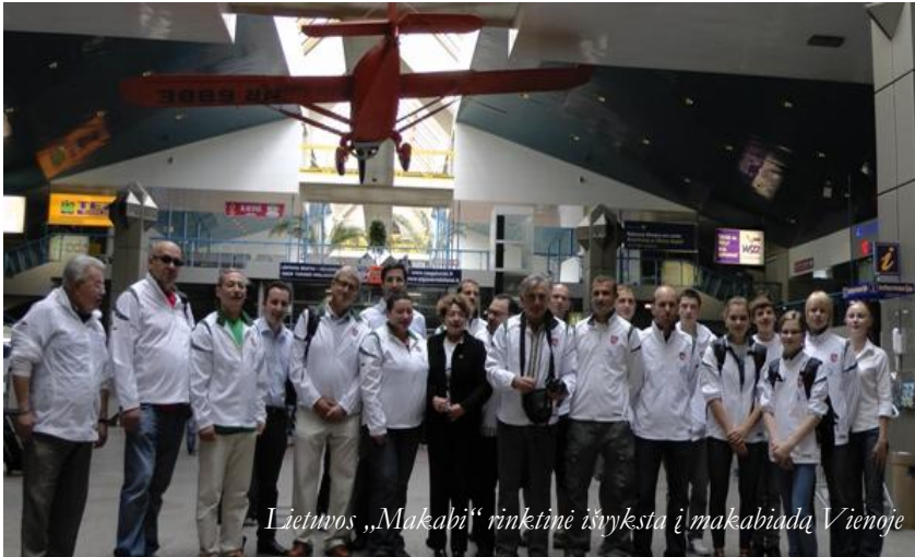
Lietuvos „Makabi“ rinktinė išvyksta į makabiadą Vienoje

Liepos 5 d. Lietuvos „Makabi“ rinktinė išvyko į Vieną, Austrijoje, kur liepos 5–13 d. vyks Europos „Makabi“ žaidynės. Šiame renginyje dalyvaus daugiau nei 2400 atletų iš 32 Europos šalių.