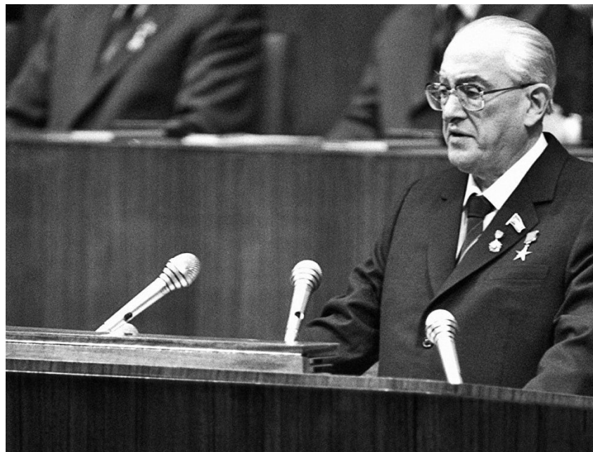
Генеральный секретарь ЦК КПСС Юрий Андропов

За годы советской власти пятерых главных «чекистов» расстреляли - Ягуду, Ежова, Берию, Абакумова, Меркулова. Других - выгоняли с большим или меньшим скандалом. Ни для кого, включая самого Дзержинского, эта должность добром не кончилась. Одноединственное исключение - Юрий Андропов, который сумел из кресла председателя «КГБ» сделать карьерный скачок в первое кресло страны - генсека ЦК КПСС.