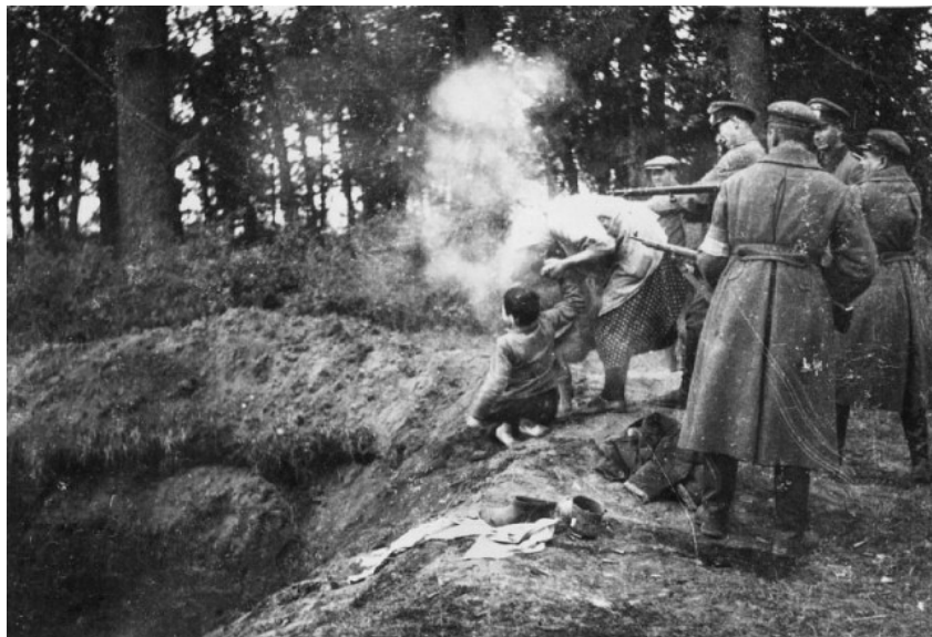
Зверства чекистов: расстрел НКВД матери с ребенком

Надо признать, «чекисты» защищали власть своих создателей старательно и без «халтуры». Всех сознательных врагов большевизма физически уничтожили (счет шел на сотни тысяч), потом взялись за потенциальных врагов, то есть тех, кто, по мнению большевиков, мог стать врагом. Здесь уже пришлось морить голодом, стрелять и загонять в концлагеря миллионы и миллионы. «Чекисты» и с этой сложнейшей работой успешно справились, чем вполне справедливо заслужили вечное проклятие всех народов бывшего СССР.